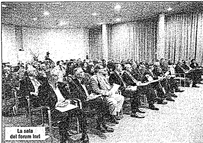
La sala del forum Inrl